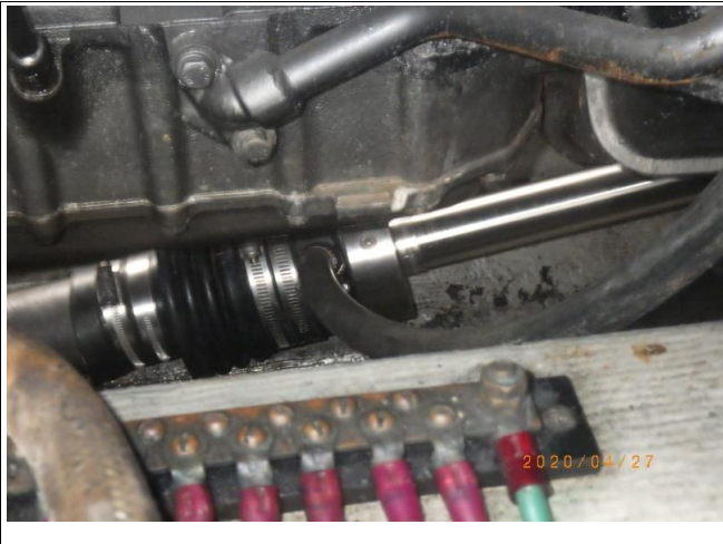
11 右舷より 漏れ無く良好